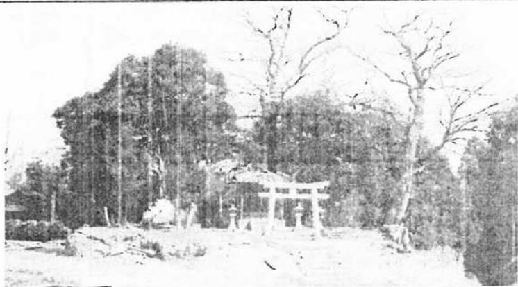
▲ 屋根瓦に鯨 唐獅子を据えた社殿 常深一統の祖神を祭る武備神社