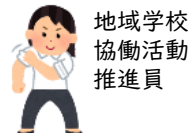
地域学校協働活動推進員