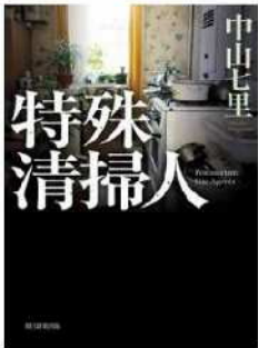
「特殊清掃人」 中山 七里

新刊本が入りました。三木市の図書館で予約の多い本や今話題の本などを中心に購入しています。雑誌も定期購読しています。自宅でゆっくり読書をするのもいいかと思えます。ご希望の本があればリクエストも受け付けています。ぜひ、ご利用ください。貸出期間は2週間、一度に5冊まで借りることができます。