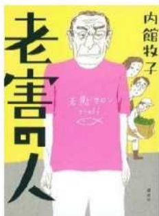
「老害の人」 内館 牧子