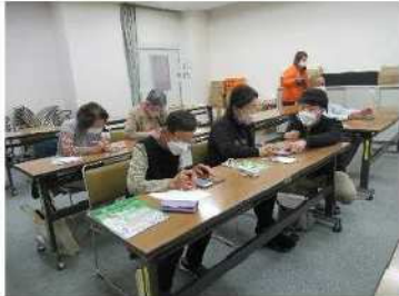
スマホ教室 「ひよこの会」

春・夏・秋に細川地域学校が開催され、スマホ教室「ひよこの会」や山田錦で糰を作る「ほそかわ花糰倶楽部」が引き続き活動されています。