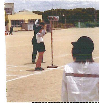
◆手信号の動作を学びました