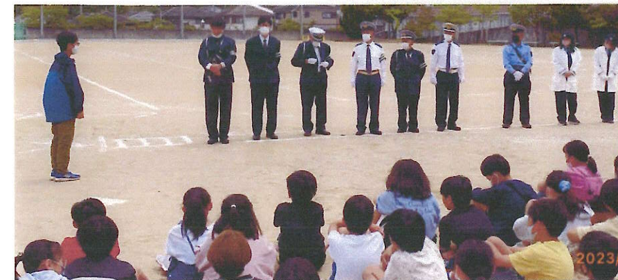
安全教室にご協力を頂いた三木警察 署の皆さん