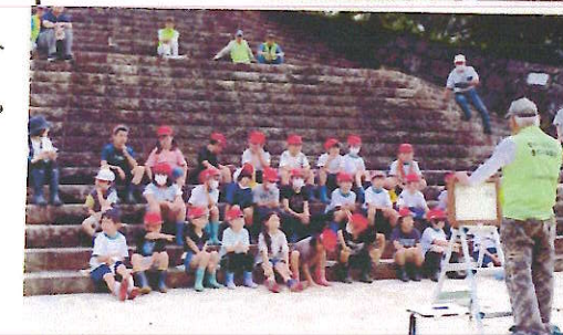
♡ 紙芝居を楽しみました