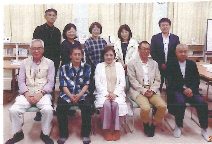
◆第1回学校運営協議会に出席された皆さん

当日の委員会は、これら委員のほかに学校 から4名、三木市教育委員会から3名が参加 されました。