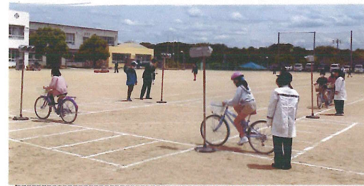
◆安全教室で交差点での渡り方

描かれた交差点には、自動で点滅する信号機設備が設置され疑似の道路環境が作られました。 1年生、2年生は、安全な道路の歩き方、横断歩道の渡り方、交差点の信号の見方などを体感し ました。6年生は、中学生になると自転車通学になります。