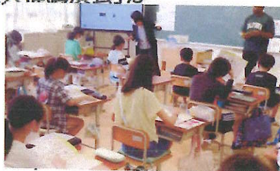
♡ オープンスクール風景