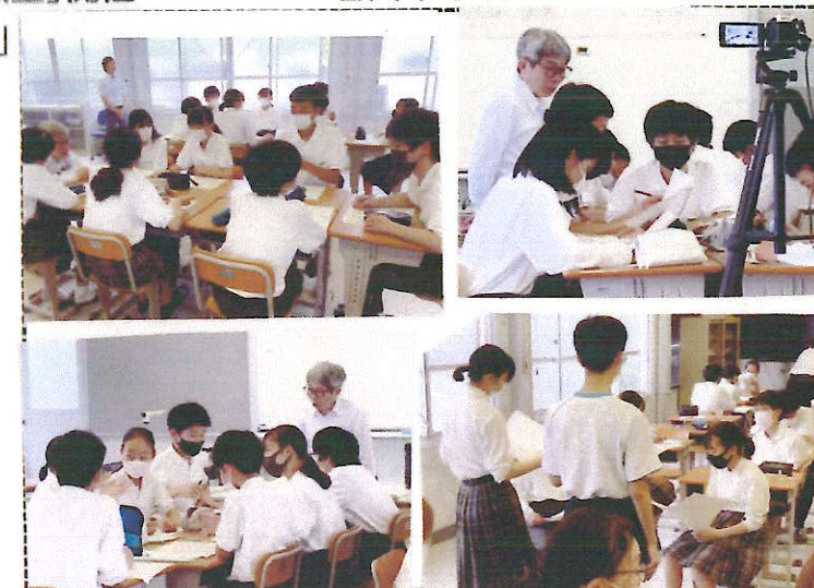
◆ 演劇手法をつかったコミュニケーションの実習

*平田オリザ氏: 兵庫県立芸術文化観光専門職大学学長。日本の劇作家、演出家。劇団「青年団」主宰。