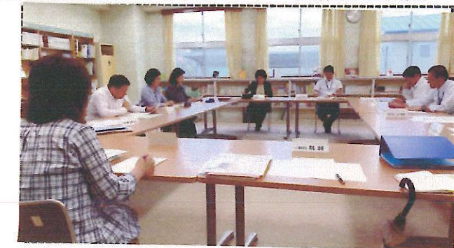
◆第一回小中一貫校教育推進委員会

本推進委員会には、3つの「部会」を設け、令和5 年度は、「コミュニティ・スクールとともに実践 していく小中一貫教育」を研修テーマとして、 具体的な取組みを小・中学校共通認識のもと進 められています。