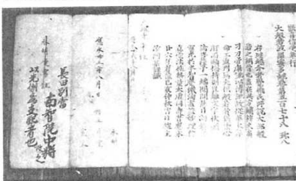
▲ 入野の大般若経（入野部落蔵）