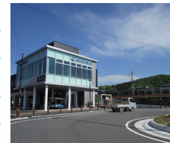
① JR太市駅を核とした4者連携による地域活性化

少子高齢化、人口減少により地域活力が低下していた太市地区の活性化に向けて、地元、民間事業者、JR西日本、姫路市の4者が連携して、民間企業の社屋と一体となった駅舎の建設や駅前広場等の整備を行いました。新たに生まれた地域の核を中心に、特産のタンパクを活用したイベント開催など地域の活性化、にぎわいの創出を図っています。