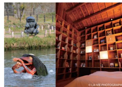
②-1. 辻川山公園の妖怪たち ②-2. NIPPONIA 播磨福崎 蔵書の館

昼食は、名物の「天船巻きずし」で知られるマイスター工房八千代の特製手作り弁当。今年1月東京銀座に「マイスター工房八千代銀座店」をオープンし、兵庫県・公民連携型アンテナショップに認証されました。ここでは味わえない田舎のおふくろの味をご堪能ください。