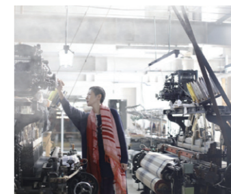
⑤ 播州織「tamaki niime村」

「国産軟鉄鍛造アイアンヘッド日本発祥の地」である市川町は、世界のゴルフトッププレーヤーが使用するゴルフアイアンヘッドの生産が地場産業です。町内は、大型集客施設が少なく、催しが開きづらいため発想を転換し、町外に出向いて町を売り込むことにしました。令和5年3月に完成した情報発信トラックは、4トンワジロングの特殊車両で、荷台部分はステージ仕様にする、長さ7m、幅約3m〜3.5mのスペースと上部には電光掲示板が現れます。アイアンと町のキャッチコピー「愛からはじまるハートのまち」にちなみ、「愛アン8-10(アイアンハート)号」と名付けました。ステージや電光掲示板を使ったゴルフクラブをはじめとする町の魅力発信のほか、災害時には町内外への物資搬送や、トラックに搭載した太陽光パネルと蓄電池を活用して電源を供給でき、災害時の拠点となることも想定しています。