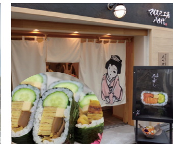
④ 八千代コミュニティプラザ マイスター工房八千代 『味 天船(あまふね)』

少子高齢化、人口減少により地域活力が低下していた太市地区の活性化に向けて、地元、民間事業者、JR西日本、姫路市の4者が連携して、民間企業の社屋と一体となった駅舎の建設や駅前広場等の整備を行いました。新たに生まれた地域の核を中心に、特産のタンパクを活用したイベント開催など地域の活性化、にぎわいの創出を図っています。