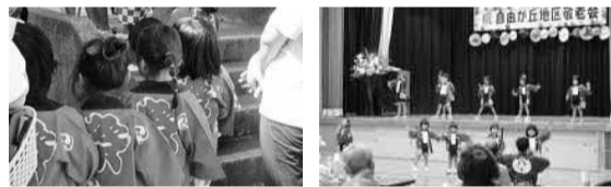
外で待つ子どもたち

はたくさん大きな拍手を頂き、演技を終えた子どもたちの顔は達成感と満足感で大きな自信に満ち溢れていました。こうして地域の方とのつながりがまた始まったことと得られる心の成長は果てしなく大きなものだと思えました。これから地域の方と共に成長していく子どもたちをどうぞよろしくお願いたします。