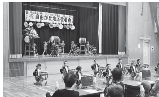
和太鼓演奏 ひろの認定こども園