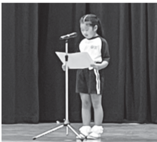
自由が丘東小学校2年