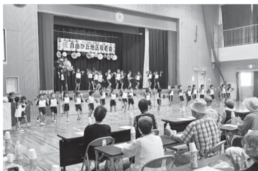
ダンス 自由が丘東小学校