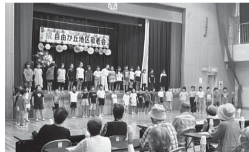
歌唱 自由が丘小学校