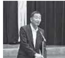
来賓挨拶 仲田市長