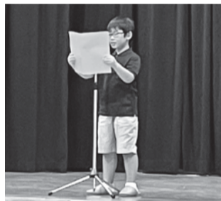
自由が丘小学校2年