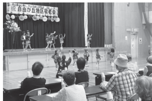
うたとダンス 自由が丘幼稚園

残暑厳しい中にも、さわやかな日差しに秋の気配が感じられる9月18日(月・祝)公民館体育館において区長協議会主催の自由が丘地区敬老会が開催されました。昨年はコロナ対策を意識して開催準備しましたが、台風の影響で中止になり、今年には実に4年ぶりの開催で、対象者となる75歳以上の方のうち100名余りの方が出席されました。園児や児童達の楽しい歌や踊り、和太鼓の心地よい響き、心温まる作文朗読、自由が丘中学校の吹奏楽では迫力ある演奏にアンコールが飛び出すなど出席の皆さんの笑顔で会場が一杯になりました。 出演してくれた自由が丘幼稚園、ひろの認定こども園、自由が丘小学校、自由が丘東小学校、自由が丘中学校の皆さん、指導の先生方、お世話していただいた自治会役員の皆様、公民館の皆様本当にありがとうございました。