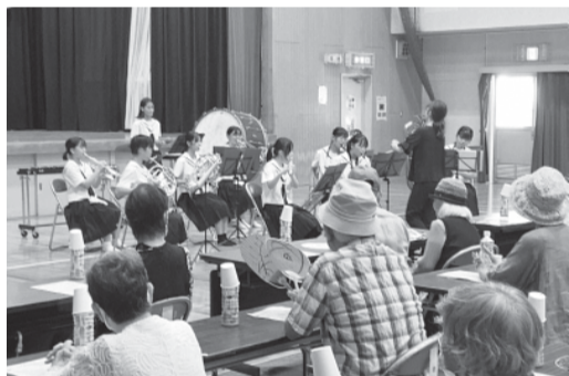
自由が丘中学校 吹奏楽部