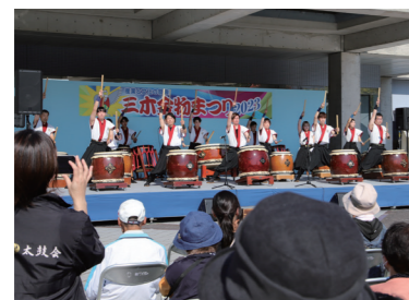
▲4年ぶりに開かれたステージイベントでは、和太鼓やダンスなどが次々と披露されました。