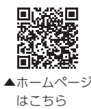
▲ホームページはこちら