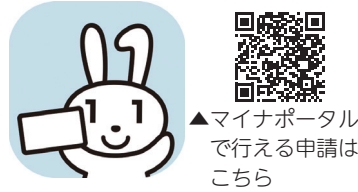
▲マイナポータル で行える申請は こちら

デジタル庁のスマートフォンアプリ「マイナポータル」で電子申請を活用すると、いつでも、どこでも、簡単に、手続きできます。忙しくて市役所に行くことが難しい方などに便利です。マイナポータルの「手続きの検索・電子申請」で「三木市」と入力すると、マイナポータルでできる「手続き一覧」を確認できます。