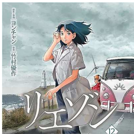
「リエゾン－こどものこころの診療所－」-12

その『リエゾン』の第12巻から「起立性調節障害」で苦しむ男子中学生へのいじめを描いたお話を紹介します。起立性調節障害とは、思春期の子どもに起こりやすく、朝起きる時などに、めまいや動悸、立ちくらみ、頭痛などの症状が現れる自律神経の病気です。