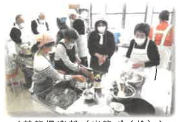
<花麴倶楽部 (米麴づくり)>

令和4年4月、「人と人がつながり、自分も地域も元気な暮らしがある細川」をめざして、地域づくりや社会参加をする人づくりを理念とした「細川地域学校」を開校し、令和5年度は「いろいろたいけん隊」、「ひよこの会」、「歴史探訪」等を開催しました。