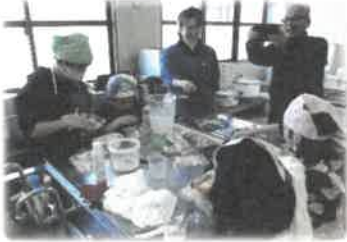
<いろいろたいけん隊>

令和4年4月、「人と人がつながり、自分も地域も元気な暮らしがある細川」をめざして、地域づくりや社会参加をする人づくりを理念とした「細川地域学校」を開校し、令和5年度は「いろいろたいけん隊」、「ひよこの会」、「歴史探訪」等を開催しました。