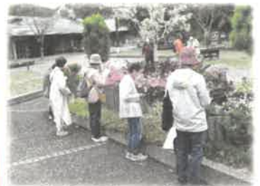
<ひよこの会 (花アリ講座)>