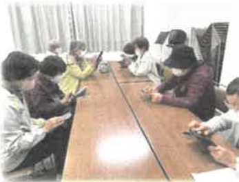
<スマートフォン講座>

このたび、3年目を迎える「細川地域学校」の取組を一層充実させるため、この取組に関心や熱意のある方を「細川地域学校運営委員」として募集します。