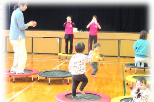
『トランポ・ロビックス』