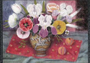
堂本印象「武士金彩壺の花」