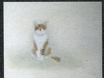
山田美耶子「ハイ・ポーズ」