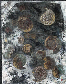
青田賢蔵「太古の海」