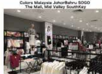
Colors マレーシア・ジョホールバルそごう店