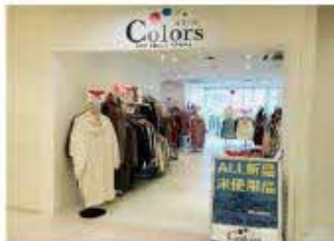
Colors カラース丸井錦糸町店