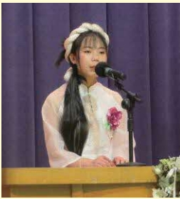
ヴォティハンさん (ベトナム)

今年は3か国から4人の在住外国人が自国の紹介や日本での暮らしなどについて日本語で発表しました。