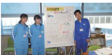
できあがった壁新聞の前に

最後に3日間で学んだことを壁新聞にして、その結果を発表しました。発表の内容はとても素晴らしいもので、感心させられるものでした。生徒たちは、今回の体験を通して多文化共生の大切さ、国際交流の重要性を学んだようでした。