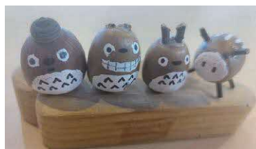
どんぐりアート(10月)