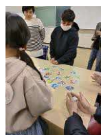
▲ 2023/12/1・12/8 自由が丘公民館 子どもの日本語教室みきっず