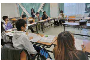
▲ 2023/11/25・12/2 中央公民館土曜日 日本語教室