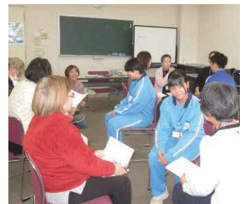
英会話教室に参加

3日目は英会話教室に体験入学をしました。最初ははづかしそうにしていた生徒たちも、慣れるにしたがって初対面の大人の方々と英会話を楽しんでいる様子でした。