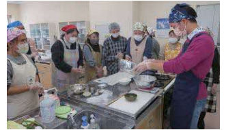
熱心に聞き入る生徒たち

葱油餅というのは台湾の屋台などで人気の料理で小麦粉をめん棒で薄くのばして何度も重ね、コショウ、五香粉、胡麻などを加えて香りを出し、ねぎを加えてフライパンで焼きます。外はサクサク、中はもっちりとしています。