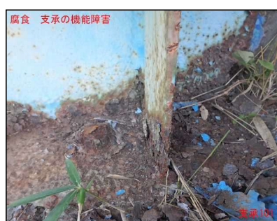
支承に腐食が見られます