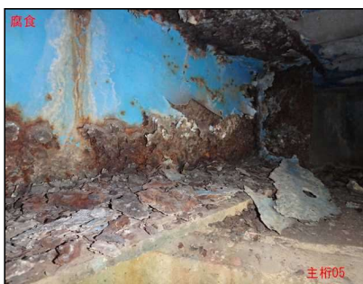
主桁に腐食が見られます