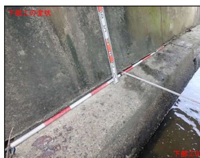
下部工に洗掘が見られます