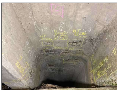
主桁に剥離・鉄筋露出が見られます