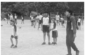
1年生と6年生がドッジボール お昼休みの様子