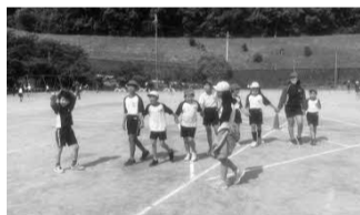
5年生と3年生のへア活動 手つなぎおにごっこ

6年生に交じって1年生と一緒にドッジボールをする微笑ましい姿も見られました。また、次のへア学年活動の時間には、上級生とクイズ大会をするんだと自分たちで役割を決めるクラスも...。今後、子どもたちが自ら進んで活動できる場を設定しながら、子どもたちの自律する力の育成を図っていきます。子どもたちだけでなく、保護者や地域の皆様とともに、笑顔あふれる学校を目指していきます。