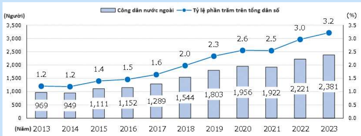
【Sự thay đổi về cư dân nước ngoài】

Tính theo quốc gia thì năm 2023 "Việt Nam" có số lượng dân số cao nhất (918 người, chiếm 38,6% tổng dân số), tiếp theo là "Hàn Quốc" với 239 người (10,0%) và "Trung Quốc" với 167 người (7,0%).