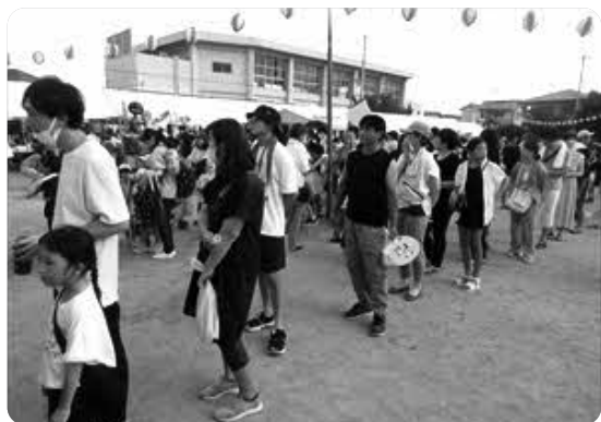
出店風景 (毎年長い行列です。)