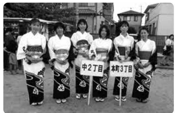
参加団体 (第1グループいざ出陣!)

フルト、抽選くじ、ヨーヨー釣りなど趣向を凝らした夜店に、子どもたちの長い行列ができました。檣では各地区からの踊り子さんを中心に、飛び入りの観客も交えて大きな輪ができ踊りを楽しみました。 老いも若きも世代を越えた交流ができ、地域の絆を深めるイベントとなりました。 開催に際しまして、ご尽力、ご協力を頂きました関係者の皆様ありがとうございます。