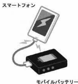
モバイルバッテリー

リチウムイオン電池使用製品は押しつぶしたり、破断したりすると発火し、火災につながるおそれがあります。リチウムイオン電池使用製品の誤った捨て方で事故が起きることを理解するとともに、正しく捨てることで「ごみ捨て火災」を防ぎましょう。