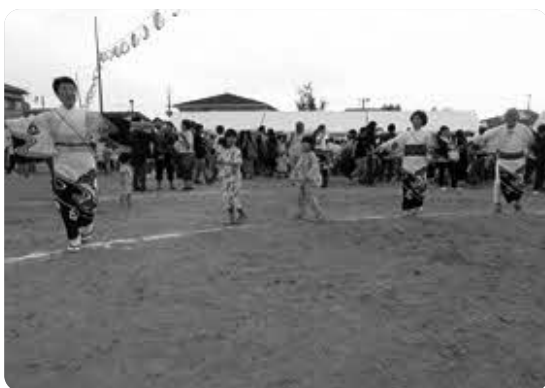
踊り風景 (大人も子どもも一緒に踊ったよ)

身の危険を感じるほどの猛暑が続く中、自由が丘、夏の最大イベントである「第48回納涼盆踊り大会」が8月3日(土)・4日(日)2日に渡って盛大に開催されました。 5月に実行委員会を立ち上げ、各地区、団体、関係者が準備を進めるなか、夜間の体育館では踊りの練習、公民館では子どもたちの太鼓の練習が行われ腕を磨きました。 大会当日は、18団体が出店され、定番の焼きそば、フランク