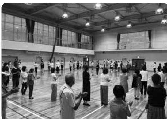
練習風景 (体育館で一息懸命練習したよ!)