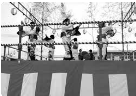
踊り風景 (檣の上で頑張りました。)