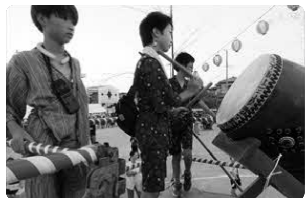
子ども太鼓 (子どもたちも楽しそう!)