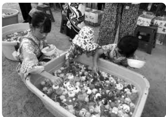
出店風景 (たくさん捕れたね!)