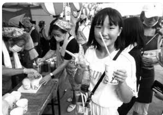
出店風景 (暑い時にはこれだね! かき氷!)