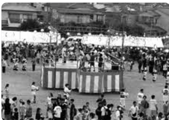
踊りの輪全景 (さあ輪になって踊ろう!)