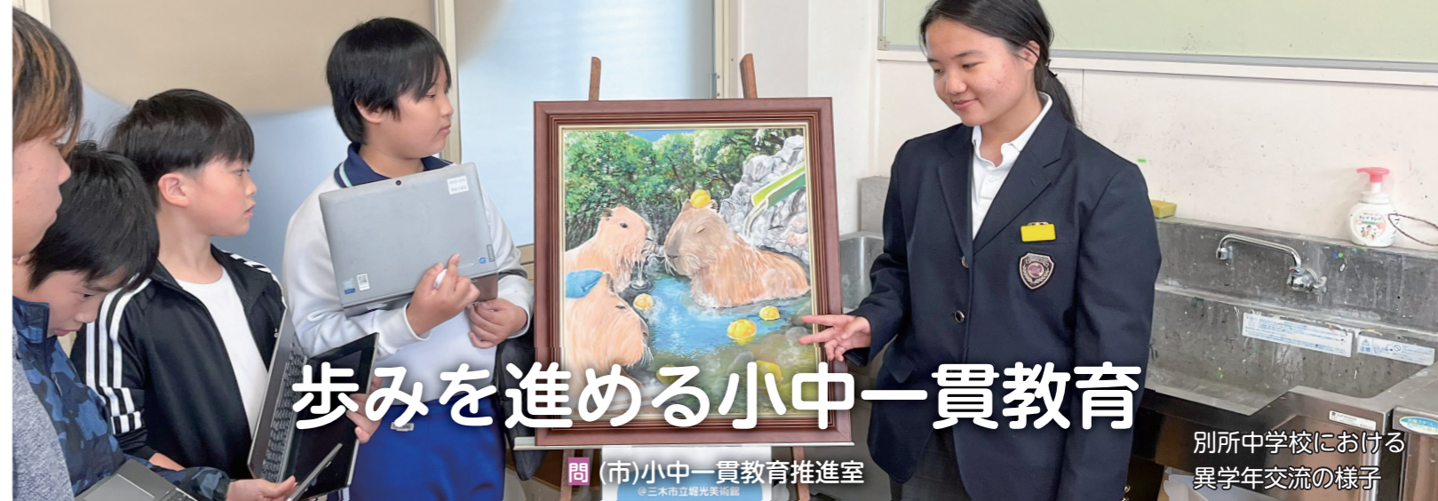
問(市)小中一貫教育推進室