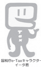
国税庁e-Taxキャラクターイータ君