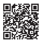
再設定できるコンビニエンスストアなどはこちら

次に該当する方は、確定申告の相談前日までに、指定の場所です。パスワードを再設定してください。