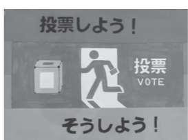
投票しよう！ 投票 VOTE そうしよう！