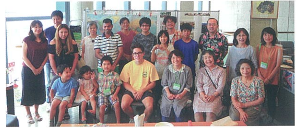
さよならパーティでは歓談と音楽を