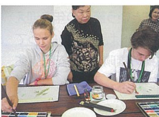
絵手紙サークルの皆さんによる うちわの絵付け体験