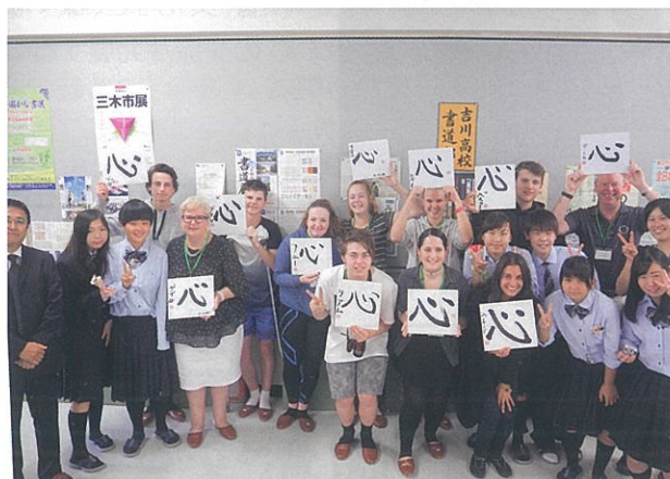
吉川高校書道部の皆さんによる書道体験