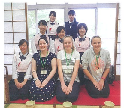
三木高校茶道部の皆さんによる 茶道体験