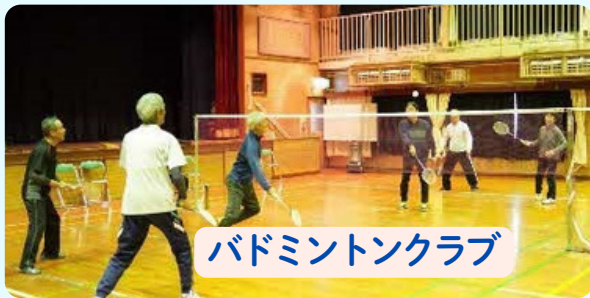
バドミントンクラブ

「バドミントンクラブ」では、高齢者向けに1チーム「3人制」で試合を行い、身体への負担軽減、ケガ防止を図っています。シャトルを思い切り打ち込んでストレス解消、試合中のミスショットや珍プレーに爆笑し、ごく稀なフラインプレーに大騒ぎしています。