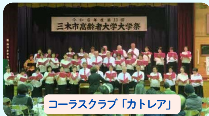
コーラスクラブ「カトレア」

「園芸クラブ」は、高齢者大学近くの農園で、野菜づくりを行い、収穫した野菜は、農園で味わったり、家庭に持ち帰ったりしています。お互いに交流しながら学びと仲間づくりをしています。