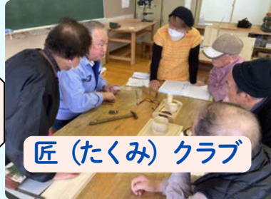
匠 (たくみ) クラブ

「匠クラブ」では、楽しみながら和気あいあいと作品作りをしています。各自の得意技を教え合い、講師の指導をおおぎながら、技を高めるとともに、親睦と健康増進を図っています。