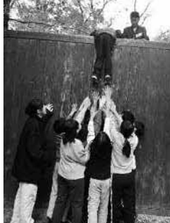
みんなで3mの壁をのぼりました

私たち大人は、つい子どもの言うままにしてしまったり、手をかけすぎてしまつことがあります。しかし、自然学校で見せた子どもたちの姿は、必要以上に手を出さず、温かく「目をかける」関わりの大切さを教えてくれました。挑戦を通して育つ力を信じ、学校・家庭・地域全体で、子どもたちを見守っていければと思います。