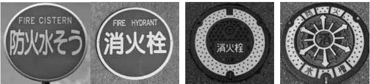
消火栓・防火水槽標識