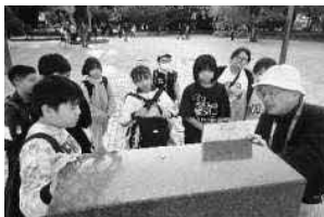
平和公園内での碑めぐり

国際情勢が不安定な昨今ですが、本校の6年生は平和の意味・大切さ、戦争の愚かさ・悲惨さについて、この一年間で自分なりの考えを持つことができました。