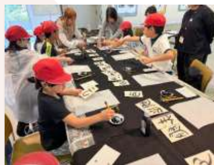
美術館での書道体験