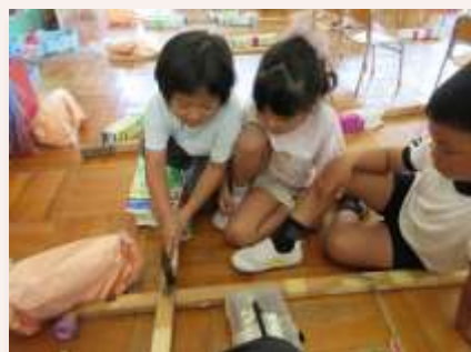
金物道具によるかしづくり

幼児教育施設と小学校が連携・協働し、「幼児期の終わりまでに育ってほしい姿」や育みたい資質・能力などを共有しながら三木市のモデルカリキュラムを作成し、子どもの育ちをつないでいきます。