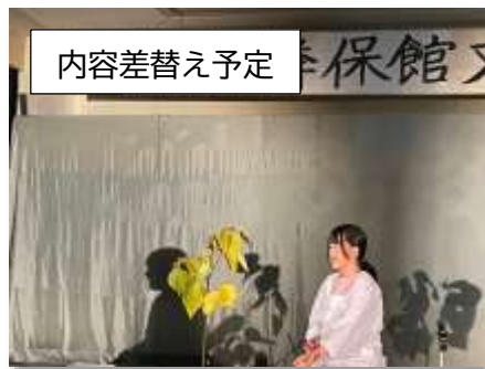
総合隣保館文化祭人権劇