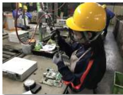
トライやる・ウィーク

「金物」「山田錦」「ゴルフ」などの三木ならではの地域資源を活用した学習や、「環境体験事業」「自然学校」「トライやる・ウィーク」など、地域の自然や文化、歴史などに関わる体験活動を充実し、豊かな感性を養うとともに、社会性や自立心、思いやりの心を育みます。