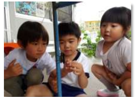
飼育しているクワガタの観察

学校園の主人公は子どもたちです。学校園には、多様な背景を持った子どもたちがあります。その全ての子どもたちが学び、成長を実感し、「今」を幸せに感じるができる学校園づくりに取り組みます。