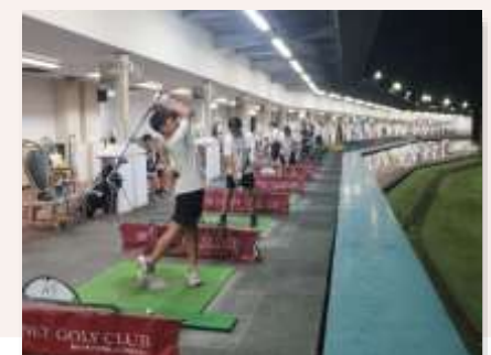
三木市地域クラブ活動「みきティブ」

関係団体等と調整しながら、地域クラブの運営に関する課題などの解決を図り、子どもたちにとって「やってみたい」「参加してみたい」と思えるような地域クラブの数を確保するとともに、地域でのスポーツや文化芸術活動の活性化を図ります。