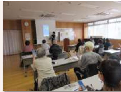
公民館におけるスマホ教室

公民館等を地域のデジタル化の拠点とし、 W i - F i 環境を活用したオンライン講座の 実施や、市民が自主的に利用して学習できる場 として提供します。