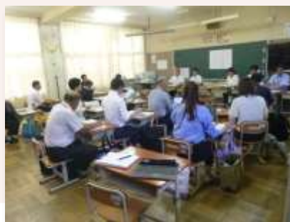
公開授業による授業研究

夏季休業中の在宅勤務の試行など柔軟な働き方を検討し、時間外勤務の縮減や休暇取得を促進することで、教職員が教育活動に専念できる環境の整備に努めます。