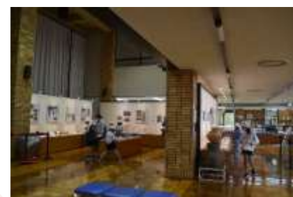
みき歴史資料館見学