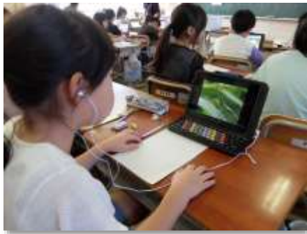
学習におけるタブレット端末の活用

タブレット端末を適切に活用するため、家庭と連携したデジタル・シティズンシップ教育を推進します。