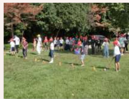
ゴルフ場でのゴルフ体験