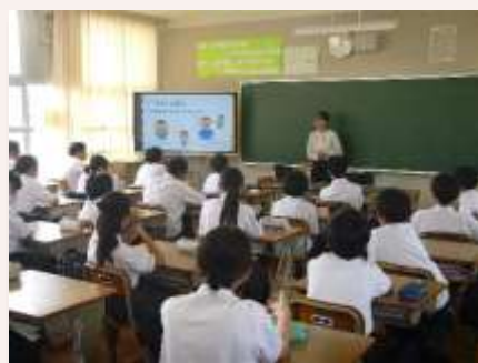
弁護士によるいじめ防止授業