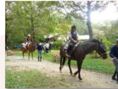
自然学校での乗馬体験