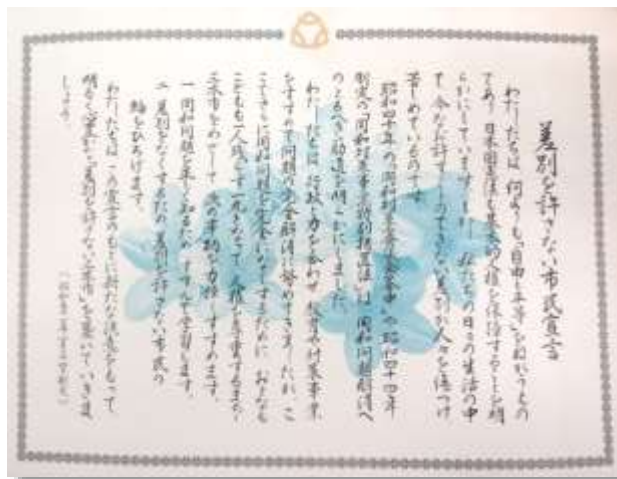
三木市では、1976（昭和51）年に、部落差別を完全になくすために市民一丸となって進んで学習していくことをめざして「差別を許さない市民宣言」が制定されました。