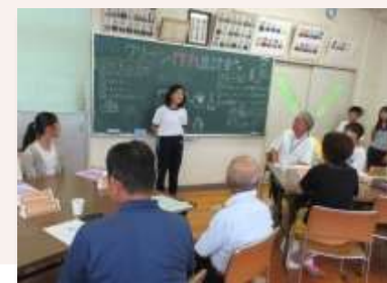
児童・保護者・学校運営協議会委員との座談会

学校運営協議会において、教育ビジョンやめざす子どもの姿を学校・地域・保護者で共有し、学校と地域の連携・協働体制を充実させ、地域全体で子どもたちの学びと成長を支えています。