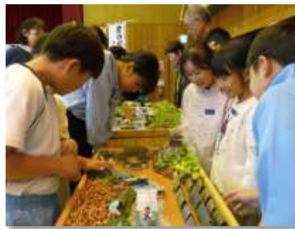
高齢者大学「昔の北播磨伝え隊」による出前授業

さまざまな知識や技能をお持ちのかたを講 師として登録し、求めに応じて紹介・派遣する 「みつきい生涯学習応援団」の充実を図るとと もに、事業の認知度を高め、市民が自主的に学 べる機会の提供を促進します。