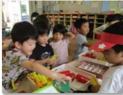
おみせさんごっこ

身近な大人から体や気持ちを受け止めてもらえることで生まれる「安心感や信頼感」の土台と、多様な「遊びと体験」を保障し、家庭と園所の保育者、地域などが協力しながら、子どもたちの「挑戦～やってみたい～」を育みます。