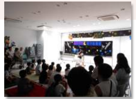
親子でわくわく夜の図書館