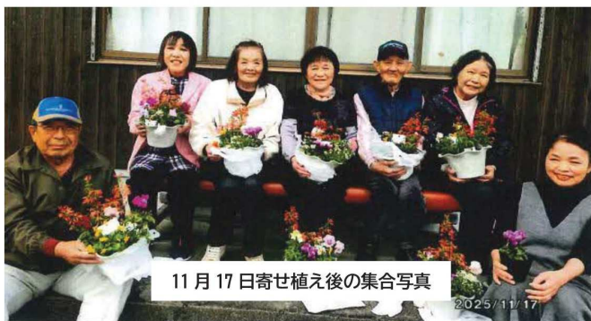
11月17日寄せ植え後の集合写真

「顔を合わせる機会があるって、やっぱり楽しい」ということを再確認するひとときになっています。