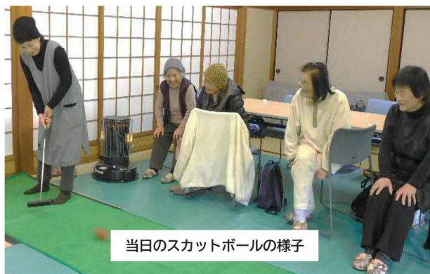
当日のスカットボールの様子

この日の参加者はボランティアを含めて10名。最初のプログラムは「スカットボール」を使った準備運動です。スティックでボールを打ち、得点穴に入れるゲームで、パターゴルフに似たゲームです。「わりあい難しいねえ」と笑いながらも、皆さんの目は真剣そのもの。ボールが転がるたびに歓声とため息が飛び交い、会場は活気にあふれていました。