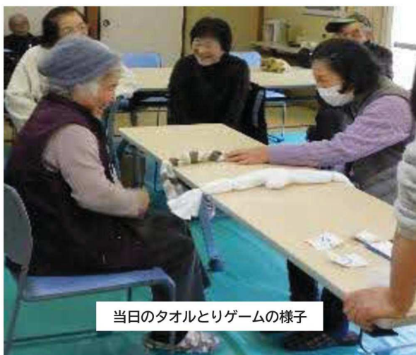
当日のタオルとりゲームの様子

続いては、北水上地区が独自で考案した「タオルとりゲーム」。色付きタオルと無地タオルを用意し、投げた空き瓶のふたの表裏の出目で色を決め、ふたが落ちた瞬間にタオルを先にとるというルールです。勝っても負けても、皆さん一喜一憂し、部屋中に笑い声が絶えません。瞬時の判断が求められるこのゲームは、楽しみながら、脳の活性化にもつながる工夫がたくさんありました。