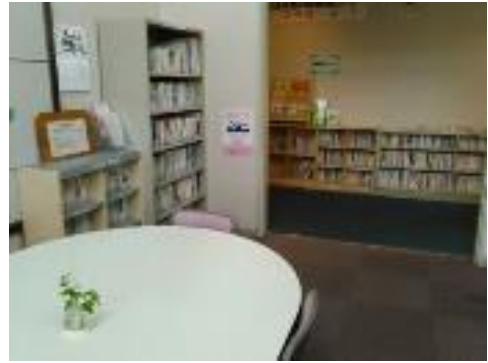
↑ こらぼーよ (図書・情報コーナー)