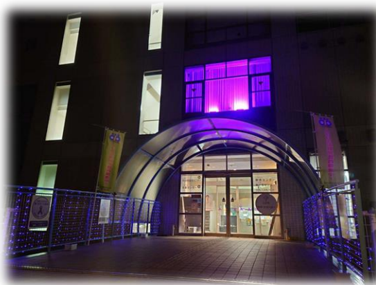
パープルライトアップの様子 左 株式会社岡田金属工業所 右 三木市立教育センター