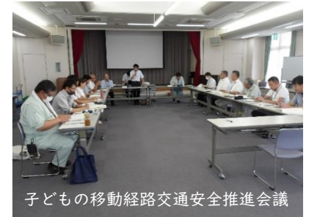
子どもの移動経路交通安全推進会議