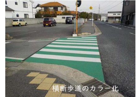
横断歩道のカラー化