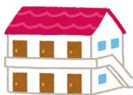
あばーと アパート