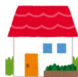
いっこだ 一戸建て