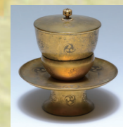
▲別所長治が愛用したと伝わる金天目茶碗(雲龍寺所蔵)