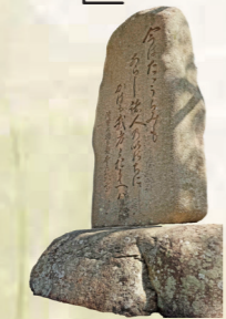
▲長治公辞世の歌碑

秀吉方の包囲はさらに強化され、三木城内に蓄えた食料は尽き、やがて家畜に与える餌までも食べたと伝えられています。餓死者が出るほどの過酷な戦いは、1年10カ月続き「三木の干し殺し」とも呼ばれています。