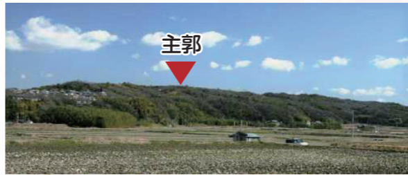
▲平井山ノ上付城跡(秀吉本陣跡) 美囊川と志染川の間の上所に位置し、主郭(本丸)から南西に三木城跡を望むことができる。秀吉が堺の茶人 津田宗及を招き、初めて茶会を開いた場所。

城を築きました。武力だけで攻め落とすのではなく、城を囲み、外から入る食料を断つことで、戦わずして相手を追い詰める「兵糧攻め」が行われたのです。付城は三木城を囲むようにして東西約6km、南北約5kmの範囲に存在していたとみられ、三木市が遺跡として明確に把握しているものは24城あります。