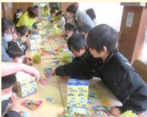
防災お菓子バッグづくりの様子（「みきウィメンズすてっぷあっぷ塾」）

また、防災寸劇や展示、体験ブースなどもあり、幅広い世代が防災について学び、考える機会となりました。