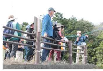
六ヶ井堰取水口を見る