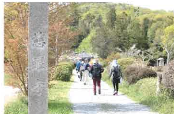
秋の紅葉が美しい慈眼寺へ