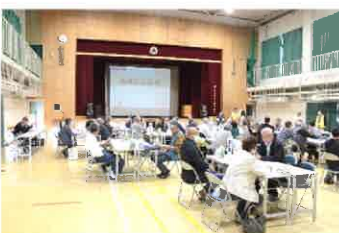
ボランティア活動プラザみき・防災リーダーの講話を聴き支えあいマップの作成

林野火災の原因の9割近くが焚火などの人為的要因とのこと。火の扱いには最大限の注意を！