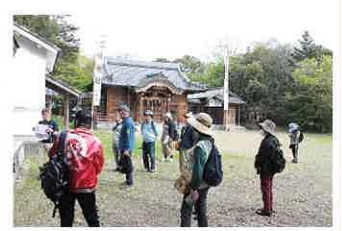
加佐の三坂神社にて