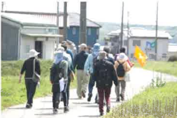
春の久留美の里を歩く

八雲神社をスタートし、慈眼寺、二皇子の仮宮跡、弁慶の足跡など、久留美の里に春の息吹を感じながら、途中六ヶ井堰取水口、最後は加佐の三坂神社とその周辺までの約5キロを歩きました。詳しい解説を聞きながら、徒歩で巡ることで見える 新しい発見 のあった散策となりました。