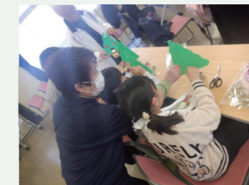
▲デコ活教室で実験をする様子

市内のさまざまなイベントで環境啓発活動を行っています。イベントに参加して、自分にできることを考え、環境を大切にする意識を高めていきましょう！