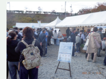
▲金物まつりでの啓発の様子