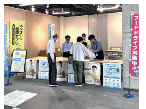
▲フードドライブの様子

家庭で余った食品(賞味期限が1カ月以上あり、常温保存可能で未開封のもの)を支援が必要な人へ届けます。