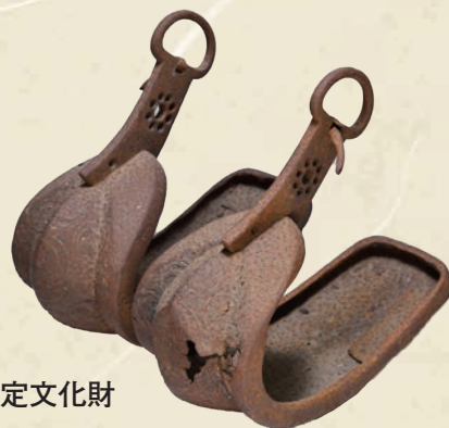
鉄鐙(雲龍寺蔵)※三木市指定文化財