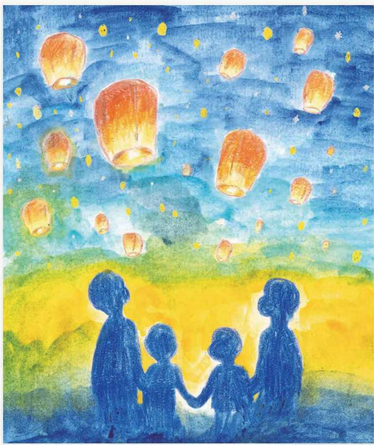
令和7年度 HYOGOヒューマンライツ作品コンテスト イラスト部門<最優秀賞> 「優しさで明るく」柴田 結衣