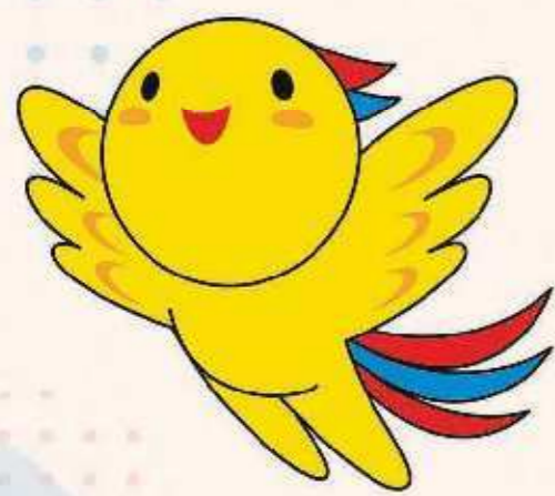
兵庫県マスコット はばたん