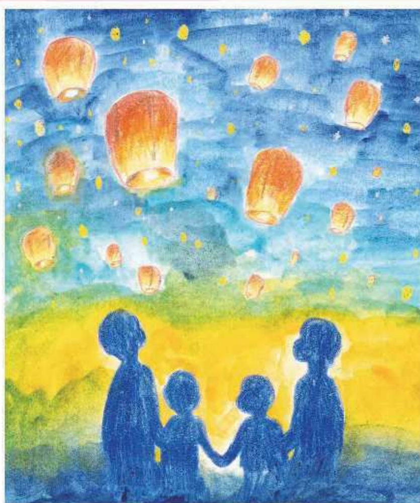
令和7年度 HYOGOヒューマンライツ作品コンテスト イラスト部門<最優秀賞> 「優しさで明るく」柴田 結衣