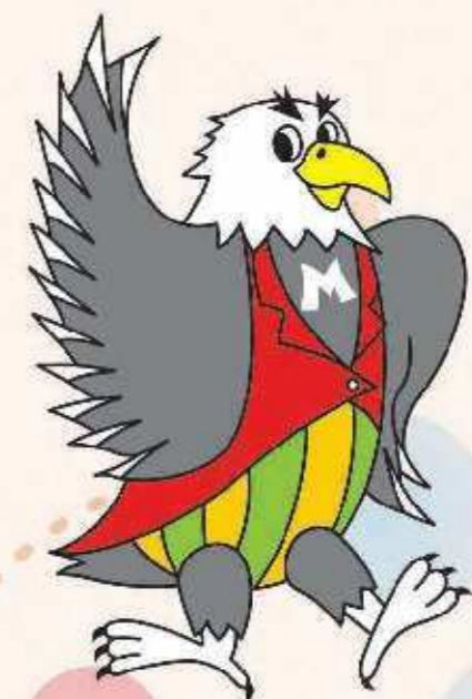
三木金物まつりキャラクター カナちゃん