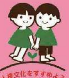
人権文化をすすめる

災害など不測の事態が発生した場合は、内容を変更・中止することがあります。この場合の詳細は、(公財)兵庫県人権啓発協会HPをご覧ください。