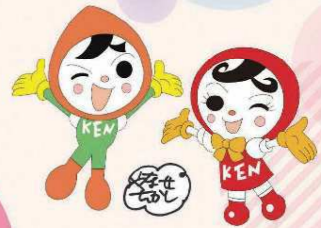
人権イメージキャラクター 人KEN まもる君・人KEN あゆみちゃん