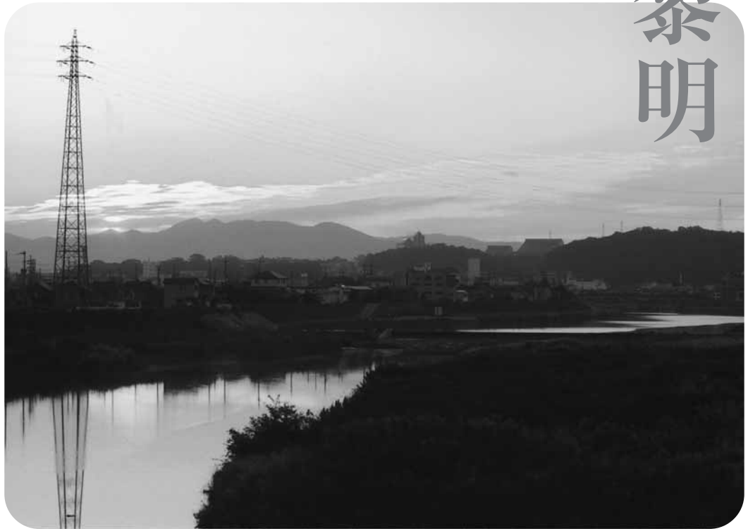
今、まさに夜が明けようとする美嚢川から望む「新三木市」