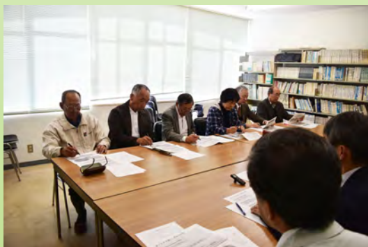
第1回志染部会の様子

今後は、平成32年度の刊行に向けて志染編の編さんに本格的に着手するとともに、順次地区ごとに編さん事業を進めていく予定です。住民の皆さんの編さん事業へのご理解と積極的な参加をお待ちしています。