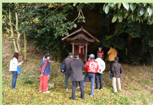
志染部会巡見調査の様子