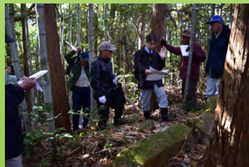
黄金塚古墳（口吉川町桃坂）の調査