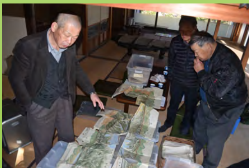
口吉川部会による資料調査の様子

今後はこうした資料を用いながら、「口吉川編」の発刊に向けて執筆等の準備を進めていきたいと考えています。