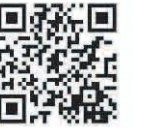
ホームページはこちら

申 ☐ ホームページ内メールフォームから必ず本人が申し込んでください。結果は3月上旬にメールで通知します。 定 先 各15名 問・申込 みきで愛(出会い)サポートセンター 〔(市)縁結び課〕☎82-8833 ☐http://www.mikideai.jp/index.html