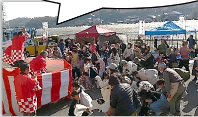
エイサーサークル かりゆし