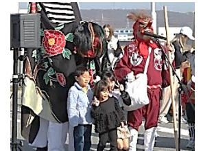
下石野獅子舞青友会