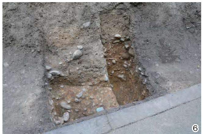
図3 各トレンチの成果 (1. 南トレンチ (南より) / 2. 南-2トレンチ / 3. 南-1トレンチの石列 / 4. 西トレンチ (北より) / 5. 西トレンチの礫敷 / 6. 西トレンチの墳丘盛土)