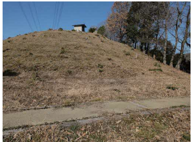
図1 愛宕山古墳 墳丘の現状