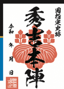
(ひでよしほんじん)