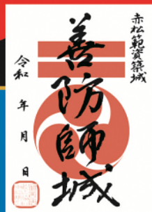
(ぜんぼうしじょう)