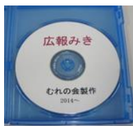
広報みき 音声訳 CD