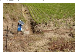
有害鳥獣対策 電気柵