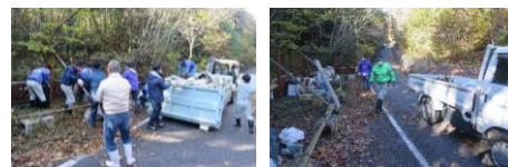
地域住民等による清掃活動