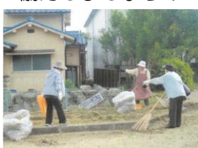
地域団体 公園清掃活動