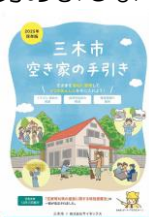
市が作成した 空家の手引き