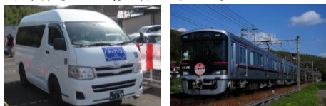
市デマンド型交通(チョイソコミき)・神戸電鉄

距離や時間に応じて、自動車の利用を控え、公共交通機関や自転車を利用して移動しましょう！