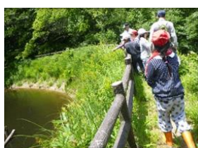
自然観察会 (増田ふるさと公園)