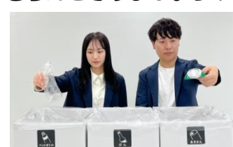
広報みき 特集記事