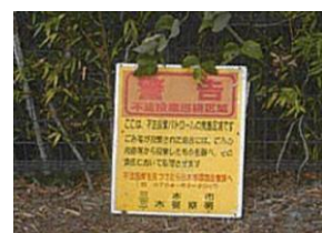
不法投棄対策 啓発看板