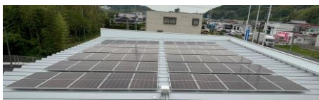
市消防署 吉川分署

自動車を購入する際は、環境負荷の少ない電気自動車等の次世代自動車を選択しましょう！