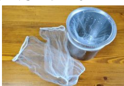
市啓発グッズ 水切りネット

レジ袋等の使い捨てプラスチック製品の使用を控えて、プラスチックごみの減量化に努めましょう！