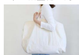
市啓発グッズ マイバッグ

レジ袋等の使い捨てプラスチック製品の使用を控えて、プラスチックごみの減量化に努めましょう！